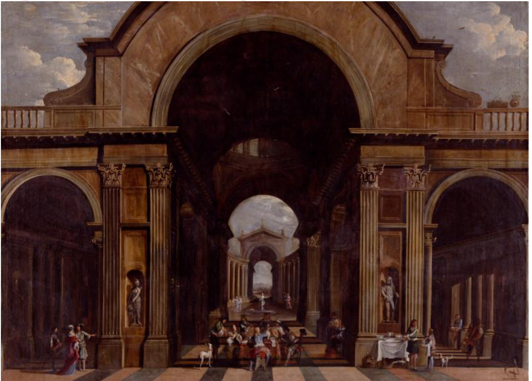
Vicente Giner. Interior de basílica con músicos en concierto alrededor de una mesa. XIX.