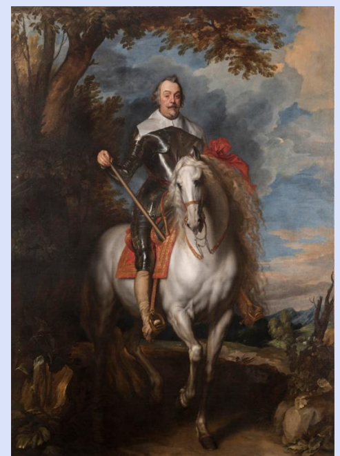
Anton van Dyck. Francisco de Moncada, III marqués de Aytona. XVII.

El pintor flamenco más importante después de Rubens pintó este magnífico cuadro, con un paisaje idealizado tras la figura del marqués, que pinta con una gran minuciosidad, típica del arte flamenco.