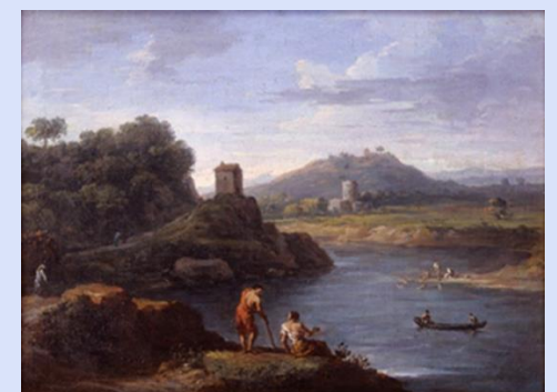
Jan Frans van Bloemen. Vista del Tíber en Acqua Acetosa

El pintor flamenco más importante después de Rubens pintó este magnífico cuadro, con un paisaje idealizado tras la figura del marqués, que pinta con una gran minuciosidad, típica del arte flamenco.