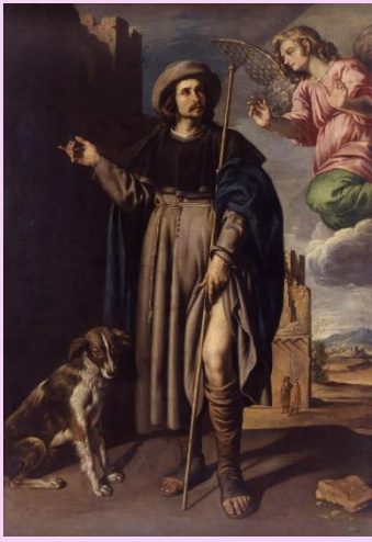
Urbano Fos. San Roque. XVII.

La sociedad barroca tenía una actitud de seguridad respecto a su entorno natural, derivada de su confianza en la capacidad de la razón para dominar la Naturaleza, pero, al mismo tiempo, el conocimiento científico de la inmensidad del Universo comenzó a generarle inseguridad. Además, en esa época el hambre, la peste y la guerra asolaron con frecuencia la sociedad europea, generando una búsqueda incesante de la salvación, a través de la religiosidad y la necesidad de evasión hacia la imaginación. Aunque el Barroco recuperó el clasicismo, se matizó con el simbolismo y un gran dinamismo frente a la serenidad renacentista, reflejando una expresividad de los sentimientos.