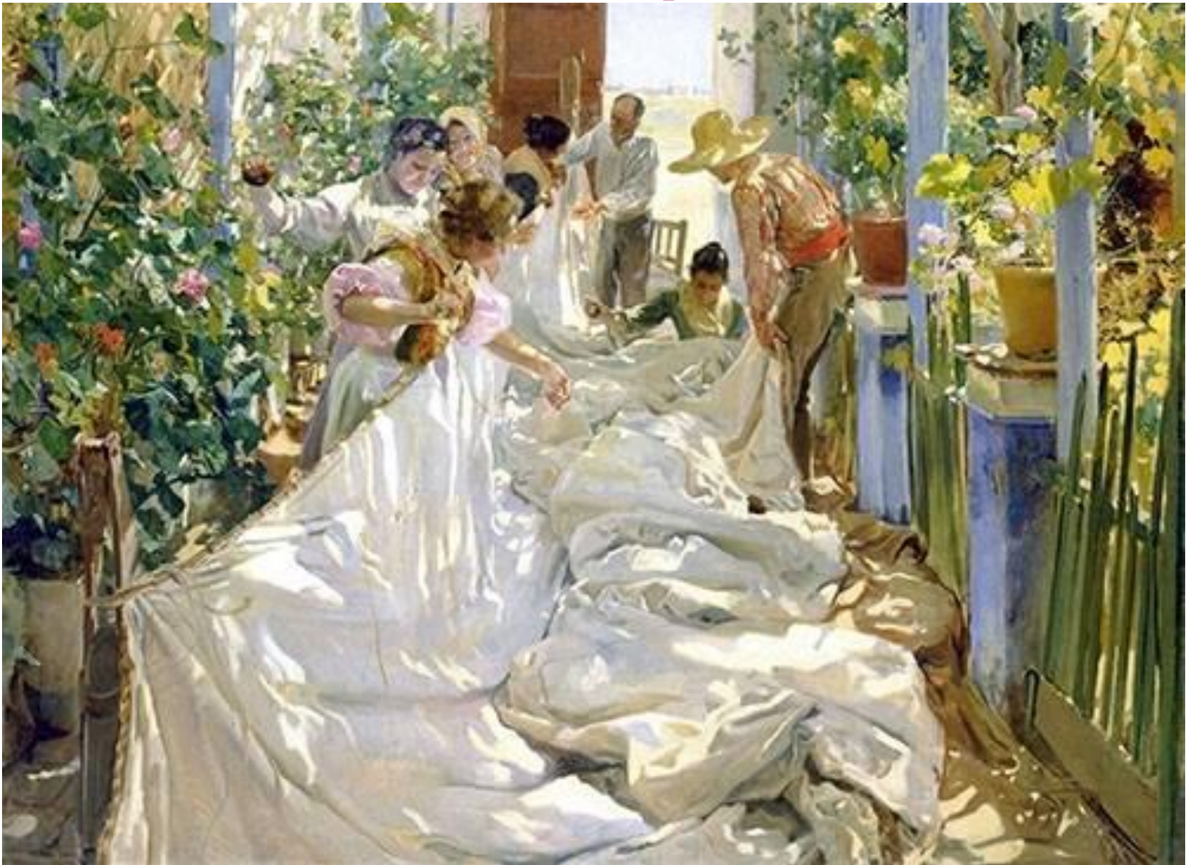
Joaquín Sorolla. Cosiendo la vela. XIX.

Teniendo en cuenta que estamos en el Antropoceno y, por tanto, podemos conducir el planeta hacia un equilibrio estable , tenemos que colaborar con la naturaleza para llegar a buen puerto y construir unidos un futuro sostenible en nuestra casa común, el planeta Tierra, siguiendo la hoja de ruta de la Agenda 2030 y los ODS. Se trata de ser conscientes de esta visión estratégica en nuestra actividad diaria para construir un mundo mejor para las futuras generaciones.