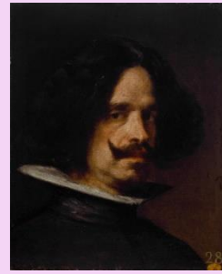
Diego Velázquez. Autorretrato. XVII

La sociedad barroca tenía una actitud de seguridad respecto a su entorno natural, derivada de su confianza en la capacidad de la razón para dominar la Naturaleza, pero, al mismo tiempo, el conocimiento científico de la inmensidad del Universo comenzó a generarle inseguridad. Además, en esa época el hambre, la peste y la guerra asolaron con frecuencia la sociedad europea, generando una búsqueda incesante de la salvación, a través de la religiosidad y la necesidad de evasión hacia la imaginación. Aunque el Barroco recuperó el clasicismo, se matizó con el simbolismo y un gran dinamismo frente a la serenidad renacentista, reflejando una expresividad de los sentimientos.