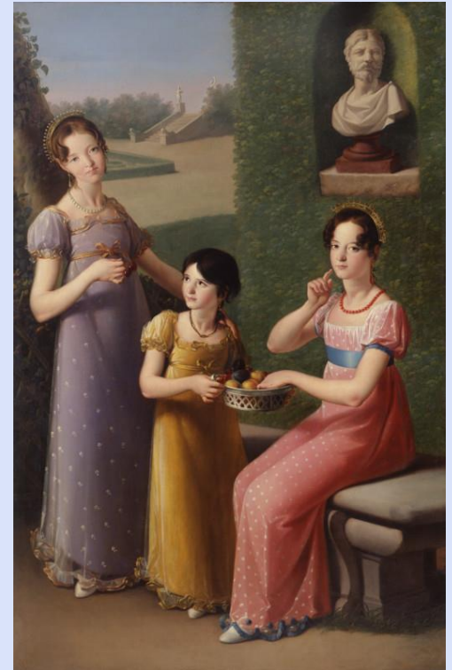
Zacarías González Velázquez. Las hijas del pintor en un jardín. XVII.

Los jardines del cuadro responden a un modelo racionalista y las figuras tienen un estilo neoclásico. El paisaje corresponde a los modelos ideales generados por la imaginación de los artistas. Hasta el siglo XVIII, no se consideró necesario reflejar la naturaleza real, sin la intromisión ordenadora del ser humano, pero se produjo un giro filosófico del concepto de naturaleza que dio lugar al Romanticismo.