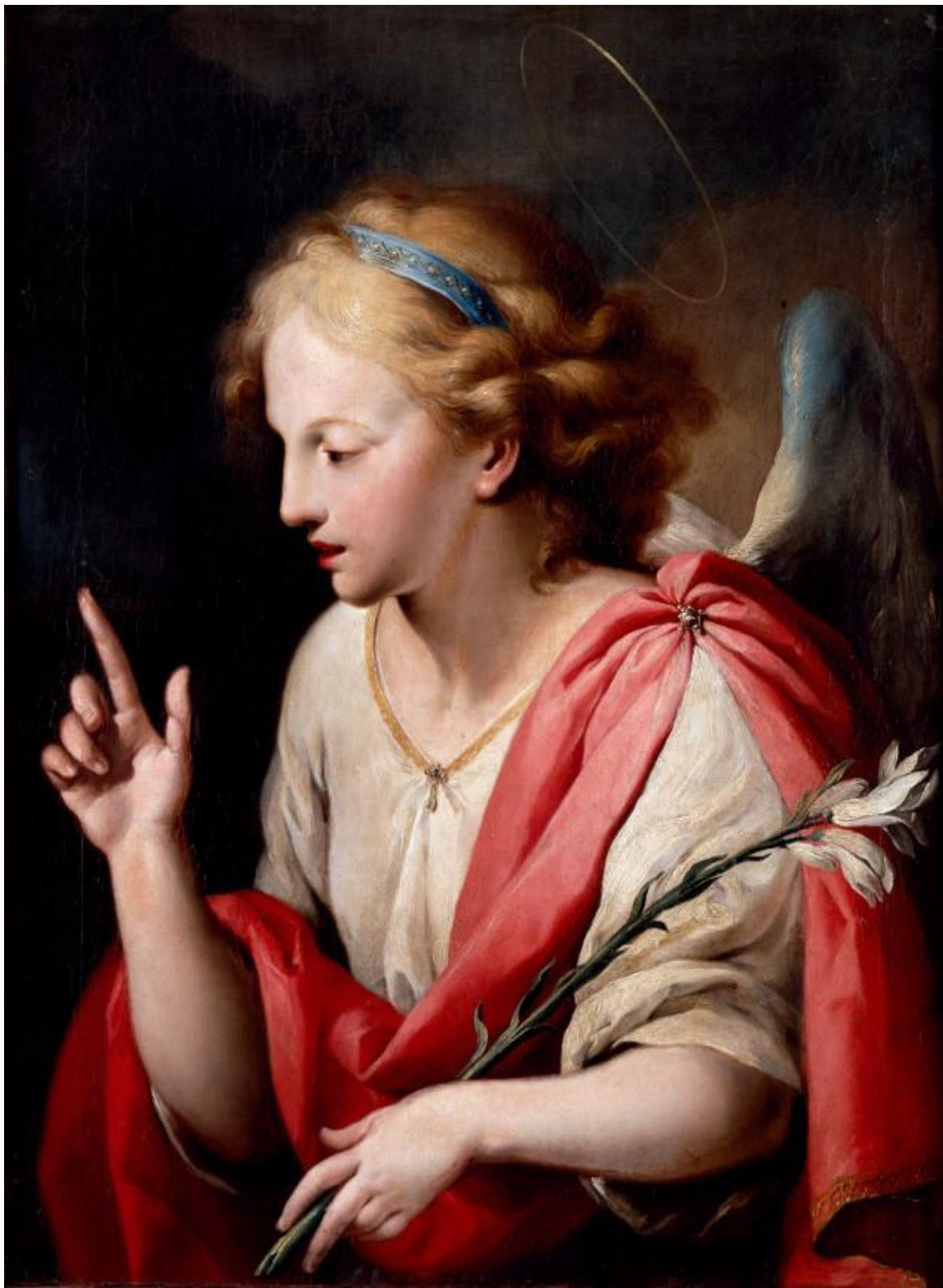
José Camarón Bonanat. El arcángel Gabriel. XVIII