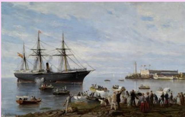
Rafael Monleón Torres. El Correo entrando en el puerto de La Habana. XIX

En el siglo XVIII , el proceso de transformación planetaria comenzó a acelerarse, con los avances tecnológicos que produjeron una revolución del régimen energético. Al mismo tiempo, la deforestación alcanzó un momento crítico. El impacto de la Revolución Industrial en el planeta tuvo tal magnitud que algunos investigadores lo señalan como el inicio de la era del Antropoceno , en la que los seres humanos constituyen la mayor fuerza impulsora de cambios en la Tierra.