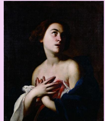
Massimo Stanzione. Santa Águeda. XVII.

La mirada al cielo de la santa muestra un sentimiento místico reforzado por la fuerte iluminación, que contrasta con las tinieblas del fondo, dándole una gran expresividad a su espiritualidad con un efecto teatral barroco, opuesto al idealismo renacentista y manierista, para evitar la belleza sensual.