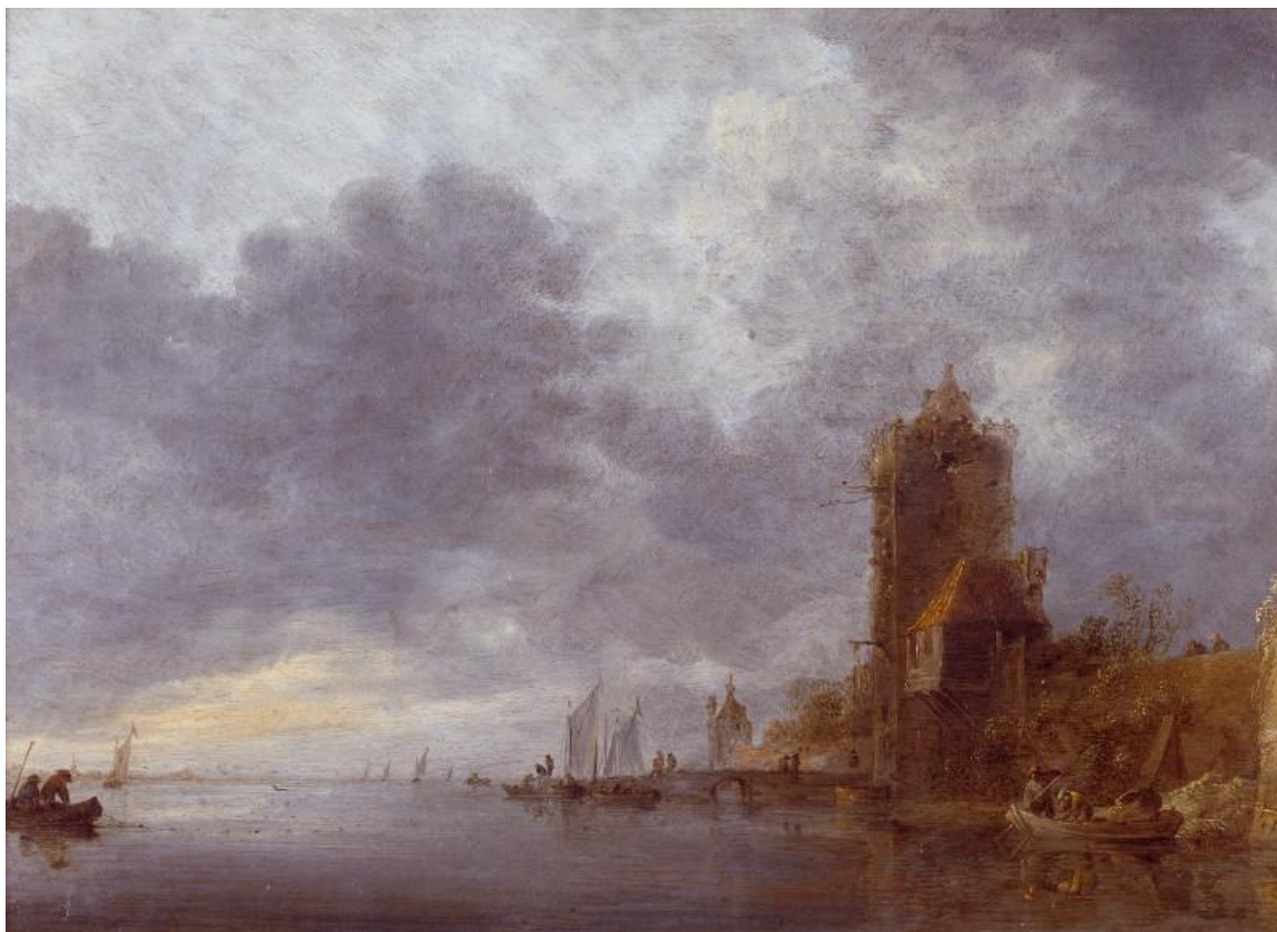
Jan van Goyen Paisaje fluvial con torre y embarcadero. XVII