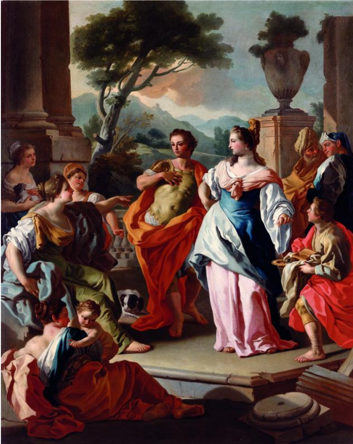
Francesco de Mura. Aquiles con las hijas de Licomedes. S. XVII.