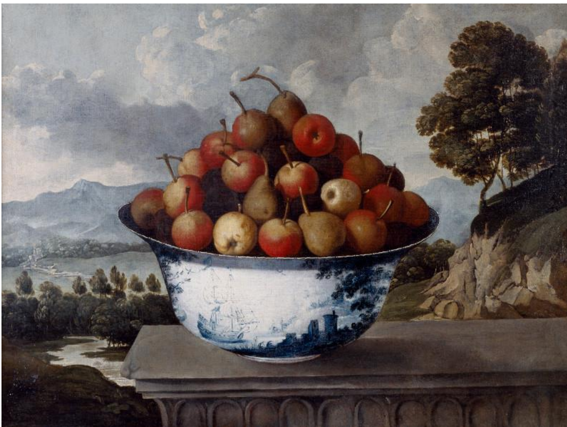
Tomás Yepes. Bodegón con frutero de cerámica, XVII.