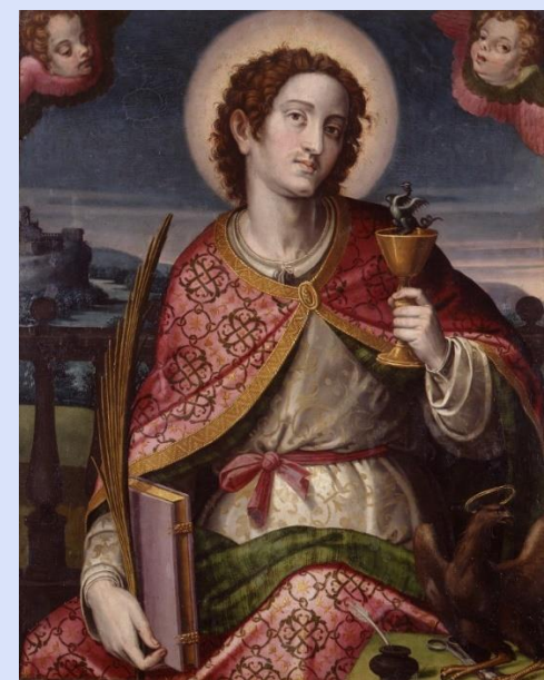
Cristóbal Llorens. San Juan Evangelista. XVI.

El siglo XVI supuso la culminación del Renacimiento y la crisis humanista, derivada de las guerras religiosas, las nuevas teorías científicas, los descubrimientos geográficos y la crisis económica. Estos tiempos de intranquilidad influyeron en el estilo de vida y se reflejó en el arte con un espiritualismo opuesto al racionalismo y la serenidad del arte clásico.