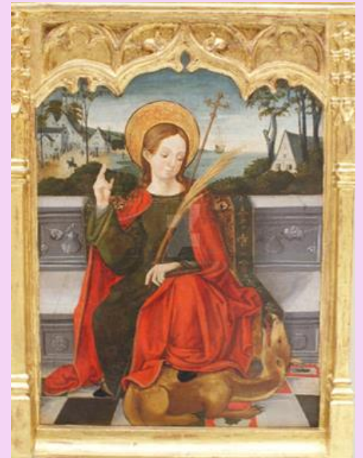
Vicent Macip. Predela con Santas . XVI.

En la Predela se aprecia la influencia renacentista en el artista valenciano, con la perspectiva y el punto de fuga en un paisaje que sustituye los fondos dorados de fines del siglo XV. El paisaje es sólo un telón de fondo que acompaña a la figura, pero empieza a adquirir relevancia. Se aprecian unas edificaciones similares a la barraca típica de la huerta valenciana, con un aire bucólico que transmite serenidad. Hay un equilibrio entre la mimesis y la expresión del ingenio particular del artista, con inclusión de la perspectiva en el horizonte.