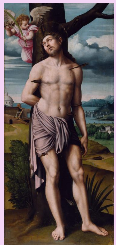
Joan de Joanes. San Sebastián . XVI.

En la Predela se aprecia la influencia renacentista en el artista valenciano, con la perspectiva y el punto de fuga en un paisaje que sustituye los fondos dorados de fines del siglo XV. El paisaje es sólo un telón de fondo que acompaña a la figura, pero empieza a adquirir relevancia. Se aprecian unas edificaciones similares a la barraca típica de la huerta valenciana, con un aire bucólico que transmite serenidad. Hay un equilibrio entre la mimesis y la expresión del ingenio particular del artista, con inclusión de la perspectiva en el horizonte.