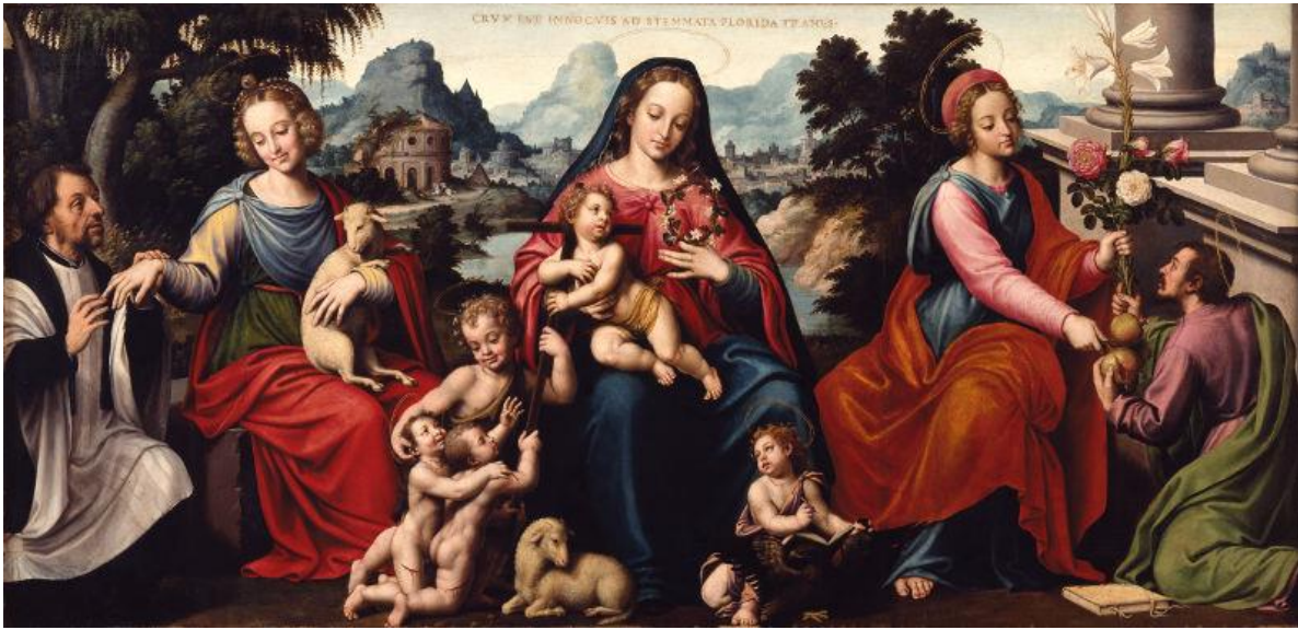
Joan de Joanes. Virgen del Venerable Agnesio . S. XVI.