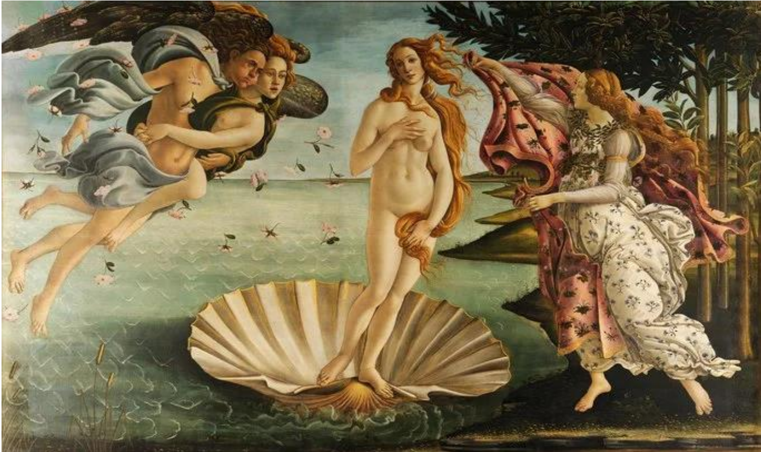
Sandro Botticelli. El nacimiento de Venus. XV.